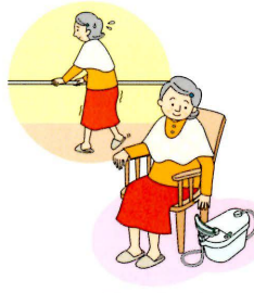
トイレまで間に合わない…