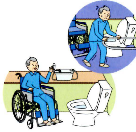
トイレまでは行けるけど…